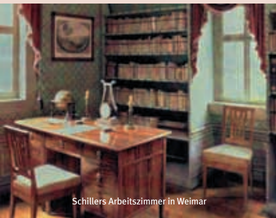
Schillers Arbeitszimmer in Weimar

An die Kleinverbraucher lieferten wir 0,2 %, an Grundpreiskunden 1,2 %, an Heizgaskunden mit den Preisregelungen »Sonderabkommen I und II« 17,9 %, an WeimarGas-Kunden 31,3 %, an Sondervertragskunden 24,2 % sowie an unsere Heiz- und Blockheizkraftwerke 25,2 %.