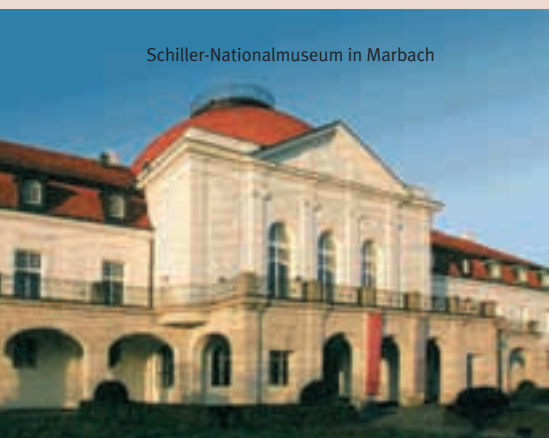
Schiller-Nationalmuseum in Marbach