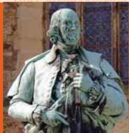
Statue Herders an der Stadtkirche in Bückeburg