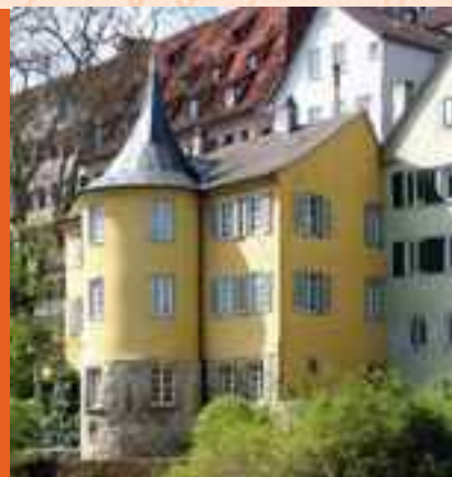
Hölderlins Domizil in Tübingen am Neckar

Die ältesten Teile des Hölderlinhauses gehörten der mittelalterlichen Stadtbefestigung an. Vermutlich aus dem 13. Jahrhundert stammen Stadt- und Zwingermauer als nördliche und südliche Begrenzungen, sowie der Sockel eines Befestigungsturms, dessen Schießscharten heute noch zu sehen sind.