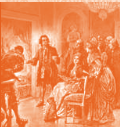
Abendgesellschaft bei der Herzogin Anna Amalia