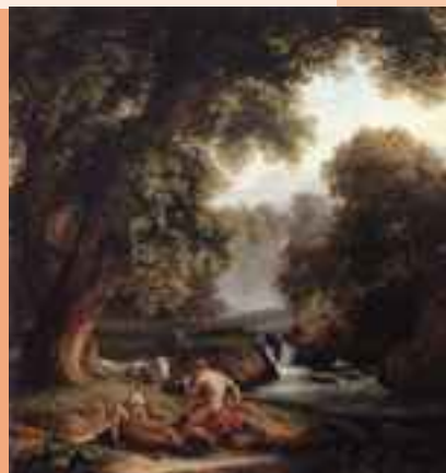
Malerei des Klassizismus von Johann Christian Reinhart

Zu den wichtigsten Motiven der Weimarer Klassik gehören unter anderem Menschlichkeit und Toleranz. Die wichtigste Gattung ist das Drama, wobei Lyrik und Epik nebensächlich bleiben.