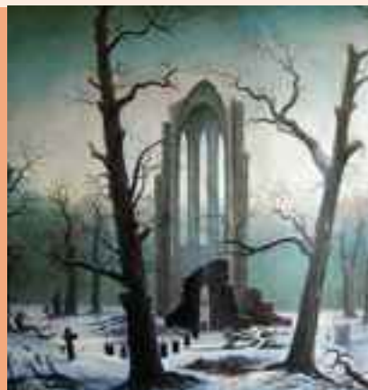
Malerei der Romantik von Caspar David Friedrich

Im Gegensatz zur Aufgabe der Dichter der Weimarer Klassik, Aufklärung, Sturm und Drang, nämlich der Erziehung des Volkes durch die Literatur, sahen die Dichter der Romantik ihre Aufgabe in der Heilung des Risses, der durch die Welt und damit durch die Individuen geht, mystisch überhöht im Begriff des »Dichterpriesters«. Eine Möglichkeit dazu bietet die Kunst, denn »die Welt hebt an zu singen, triffst Du nur das Zauberwort« (Eichendorff). Die Romantiker suchten die verlorene vergangene Welt in den Werken aus der »Kindheit der Menschen«, also in den Märchen und Sagen, in den Volksliedern, im Mystizismus des Mittelalters.