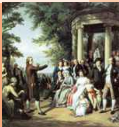
Theobald von Oer: Der Weimarer Musenhof (Ausschnitt)

Seine ästhetische Betrachtung der griechischen Kunst war die Grundlage für die Zeit der Klassik. Auch die literarische Klassik, später auch Weimarer Klassik genannt, blieb diesen Grundsätzen treu.