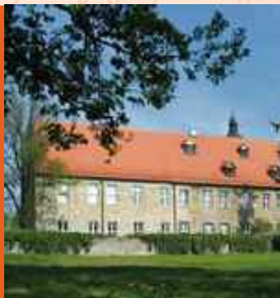
Schloss Oberwiederstedt ist Sitz der Novalis-Forschungsstätte

1772 wurde das Gut, das die freiherrliche Familie von Hardenberg im 17. Jahrhundert durch Heirat zu ihren Besitzungen gewinnen konnte, zur Geburtsstätte des Dichters Friedrich von Hardenberg, der sich Novalis nannte.