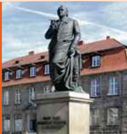
Jean-Paul-Denkmal in Wunsiedel

Seine letzten Lebensjahre waren von Krankheiten gezeichnet: 1823 erkrankte Jean Paul am Grauen Star und erblindete allmählich. 1825 kam Brustwassersucht hinzu, an der er am 14. November verstarb.