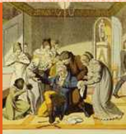
Zeitgenössische Darstellung von Kotzebues Tod

Kotzebues politische Statements, die in der Öffentlichkeit zu lesen waren, haben letztlich nicht nur den Theologiestudenten Sand zu seinem Attentat verführt, sondern auch die Urteile über den Ermordeten nachhaltig beeinflusst und gefärbt.